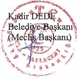
Kadir DEDE Belediye Başkanı (Meclis Başkanı)

Belediyemiz 2023 Yılı Bütçesi ve bütçe tasarıları meclisimizce görüşülüp oy birliği ile kabul edildiğinden; Bütçe ile ilgili olarak Belediye Başkanı söz alarak meclise teşekkür etti ve 2023 yılı bütçesinin Belediyemize hayırlı uğurlu olmasını diledi. 02/11/2022