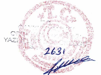
Mevlüt TAPLI Kâtip Üye